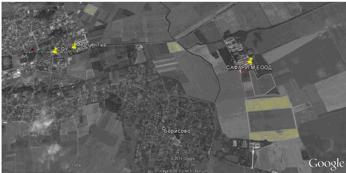
Фиг. II.8-2 Сателитна карта с местоположение на ИП с указани близко разположени обекти, подлежащи на здравна защита

ИНФОРМАЦИЯ ЗА ПРЕЦЕНЯВАНЕ НЕОБХОДИМОСТТА ОТ ОВОС ЗА ИП: Монтиране на втори модул-дестилатор в инсталация за етерични масла към съществуваща Линия за преработка на стокова продукция и преустройство на парния котел от твърдо гориво – пелети на гориво – природен газ