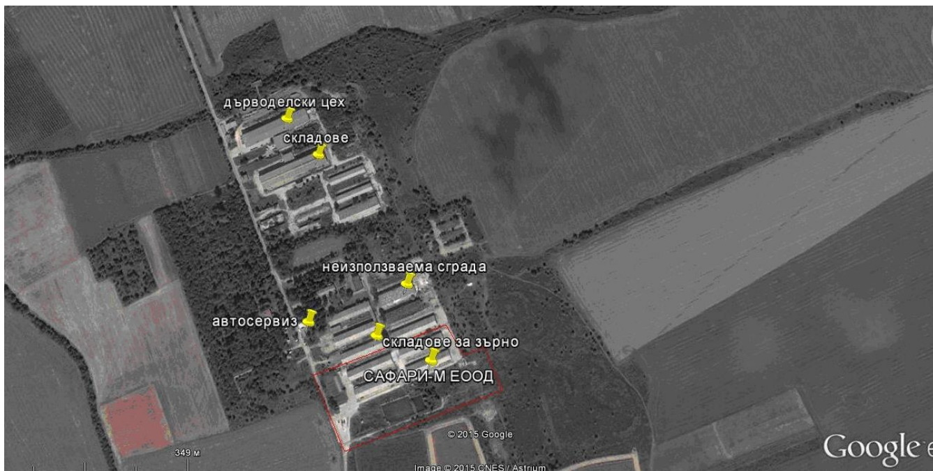
Фиг. II.8-3. Сателитна снимка с местоположение на ИП, с посочен начин на ползване на съседните имоти